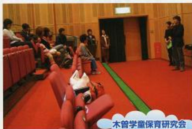
木曾学童保育研究会