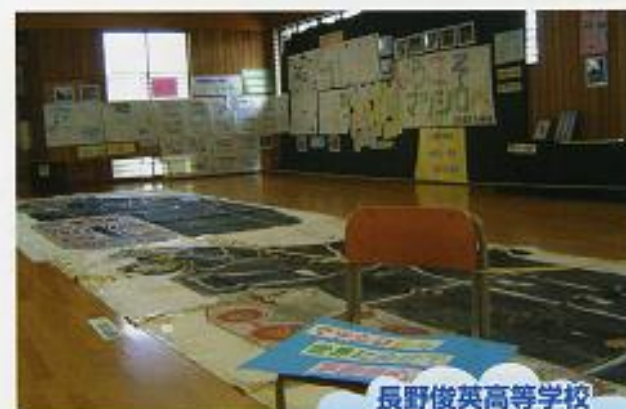
長野俊英高等学校 郷土研究班