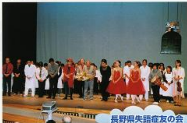
長野県失語症友の会