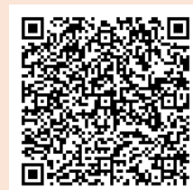
<ホームページQRコード>

https://www.pref.nagano.lg.jp/jinken-danjo/kurashi/jinkendanjo/danjo/main/leader.html