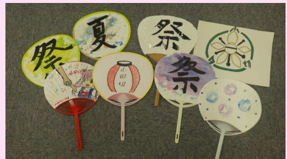
長野翔和学園(長野市)の在生による作品