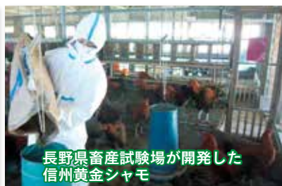
長野県畜産試験場が開発した信州黄金シャモ