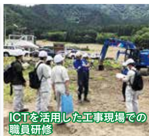
ICTを活用した工事現場での職員研修