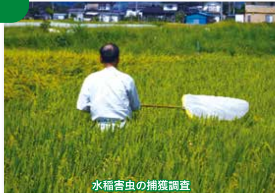
水稲害虫の捕獲調査