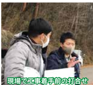
現場で工事着手前の打合せ