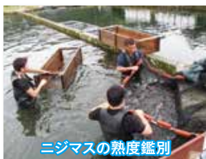
ニジマスの熟度鑑別