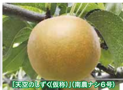
「天空のしずく(仮称)」(南農ナシ6号)