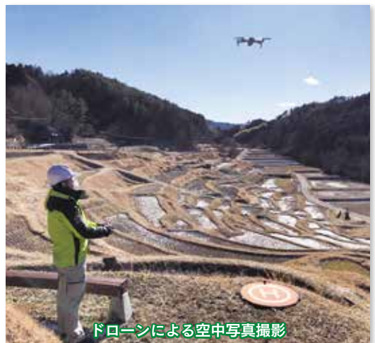
ドローンによる空中写真撮影