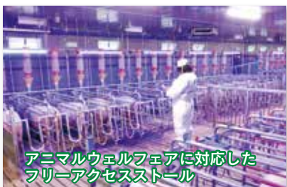
アニマルウェルフェアに対応したフリーアクセスストール