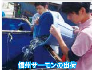
信州サーモンの出荷