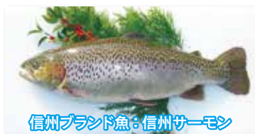
信州ブランド魚: 信州サーモン