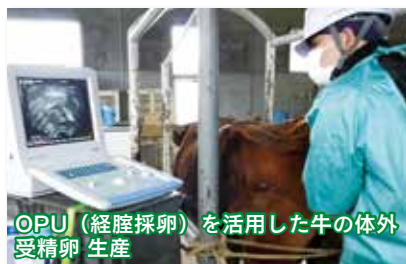
OPU (経膈採卵) を活用した牛の体外受精卵 生産