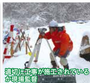
適切に工事が施工されているが現場監督