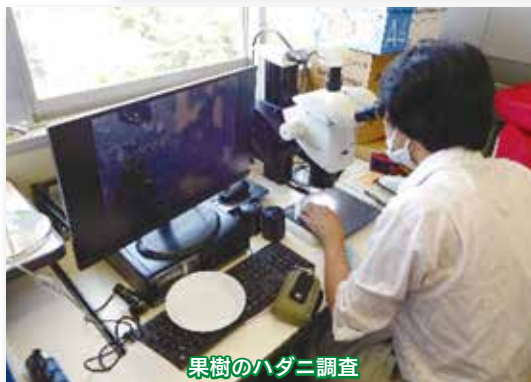
果樹のハダニ調査