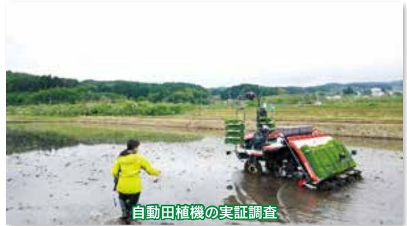
自動田植機の実証調査