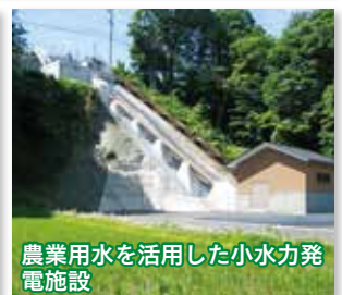
農業用水を活用した小水力発電施設