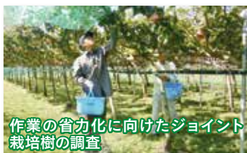
作業の省力化に向けたジョイント栽培樹の調査