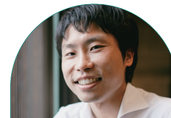
建設部都市・まちづくり課 (信州地域デザインセンター担当)