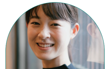
建設部都市・まちづくり課 (信州地域デザインセンター担当)