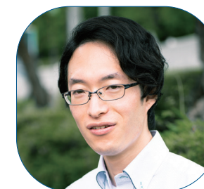
総務部コンプライアンス・行政経営課