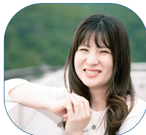
企画振興部 DX推進課