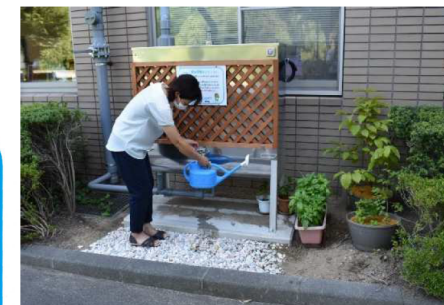
流出抑制に効果があるほか、貯まった水を水やり等に活用できます！