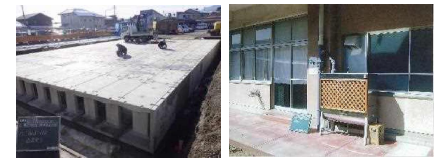
雨水貯留施設設置例 (長野市豊野支所) 雨水貯留タンク設置例