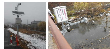
簡易型河川監視カメラ 危機管理型水位計