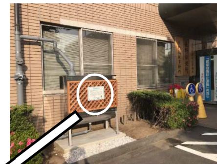
長野保健福祉事務所庁舎(R3.6)