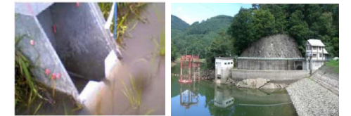
水田排水口の調整装置設置例 ため池の低水位管理実施例

◇目標: ため池を活用した雨水貯留の取組 404箇所 水田を活用した雨水貯留の取組 6市町村