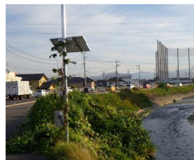
簡易型河川監視カメラ