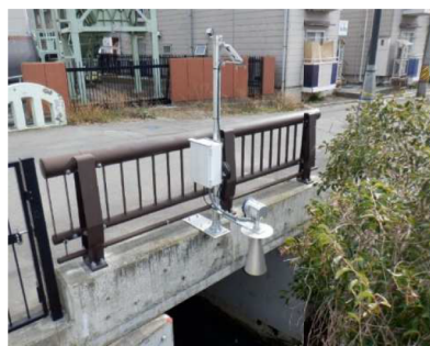
危機管理型水位計