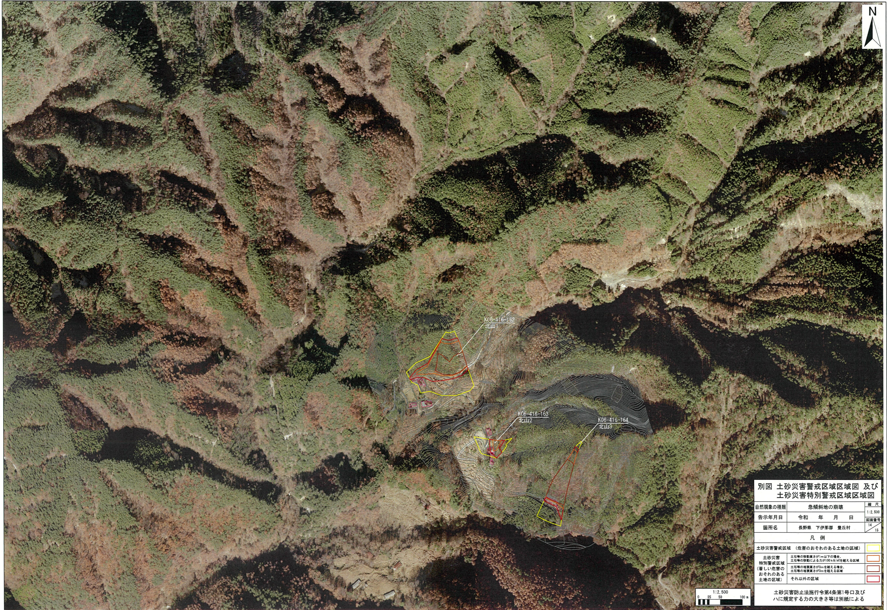
別図 土砂災害警戒区域区域図 及び 土砂災害特別警戒区域区域図