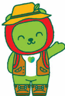
長野県PRキャラクター「アルクマ」 (飯田D.C.バーション) ©長野県アルクマ

※この取組は、しあわせ信州創造プラン 2.0(長野県総合5か年計画)の「第4編 3-8 本州中部広域交流圏の形成」に基づくものです。