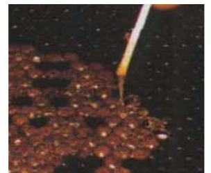
アメリカ腐蛆病： 糸を引く蜂児