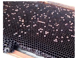
アメリカ腐蛆病の巣脾