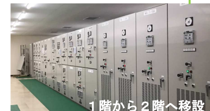
復旧後の管理本館電気室