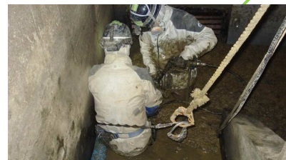
被災直後の汚泥除去