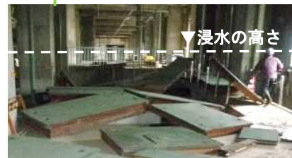
被災直後の水処理棟