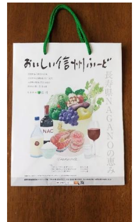
トイレットペーパー おいしい信州フード紙袋