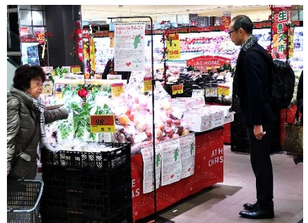
相鉄ローゼンでのりんご販売