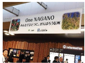
長野駅バナー掲出