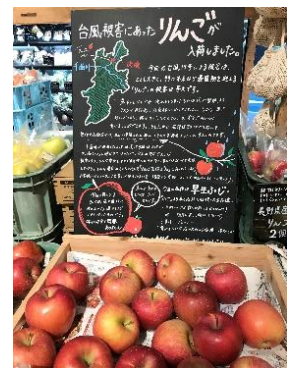
無印良品でのりんご販売