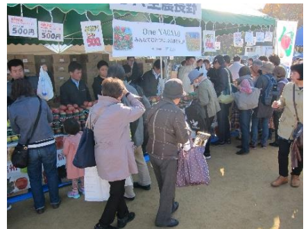
大阪城祭りでのりんご販売