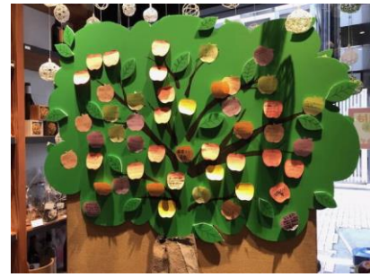
応援メッセージボード