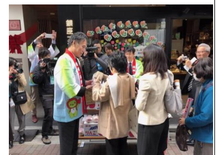
りんごを手渡す阿部知事