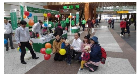
長野駅で子供たちに風船をプレゼント