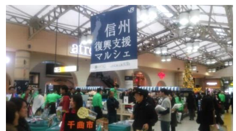
上野駅で観光PRと特産品販売