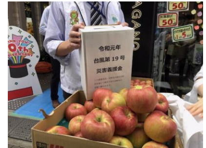
店頭でのりんご販売・義援金募集