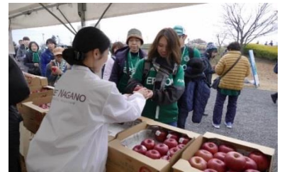
松本山雅ホームゲームでのりんご配布