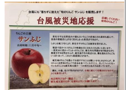
カタログギフト「信州産直便」