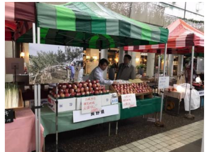
NAGANOマルシェでの被災地産りんご販売