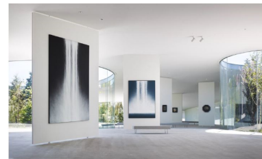
軽井沢千住博美術館