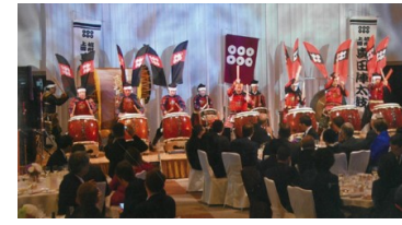
アトラクション 信州上田真田陣太鼓保存会 (和太鼓の実演・体験)