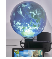
小型インタラクティブ地球儀