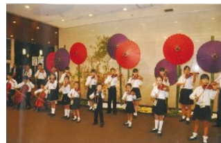
歓迎演奏 スズキ・メソード (ヴァイオリン演奏)