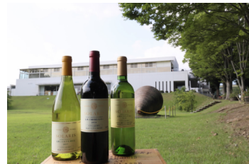
マンズワイン株式会社 小諸ワイナリー