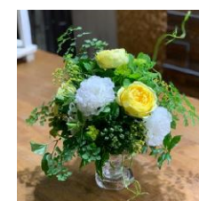
パーティーフラワー

・長野産花きによる会場装飾 ・軽井沢町内の歓迎装飾 ・コヒブレイクで県産スイーツ・果物を提供