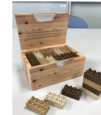
おが粉ブロック (自然素材のやさしいブロック玩具)