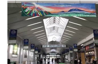
軽井沢駅自由通路