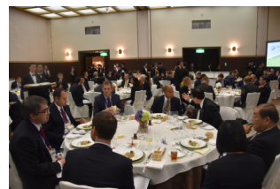
2016年 G7 交通大臣会合

信州サーモン、信州プレミアム牛肉、アスパラガスなどの 県産食材を使用した料理や原産地呼称管理制度認定日本酒・ ワイン、アトラクションで各国・機関の代表者をおもてなし