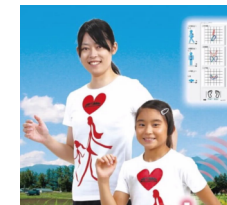
体幹2点歩行動揺計