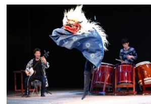
アトラクション 和力(わりき) (獅子舞等伝統芸能)