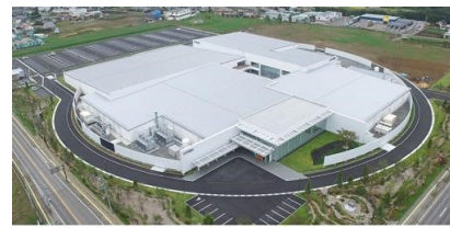
シチズン時計マニュファクチャリング株式会社 ミヨタ佐久工場