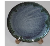
飾り皿 (県指定伝統工芸品)