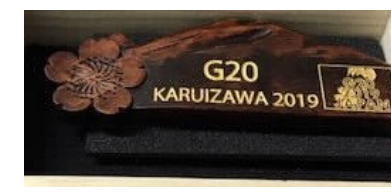
ピンバッジ (県指定伝統工芸品)