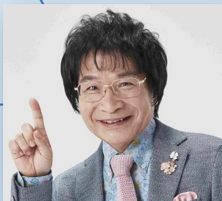
教育評論家 尾木 直樹氏 (尾木ママ)

そこで、教育評論家の「尾木ママ」 こと尾木直樹氏、脳科学者の茂木 健一郎氏をお招きし、阿部知事と 「学びの県づくり」をテーマに熱く 語る、名付けて「おぎ・もぎ・あ べ鼎談」の参加者を募集します。