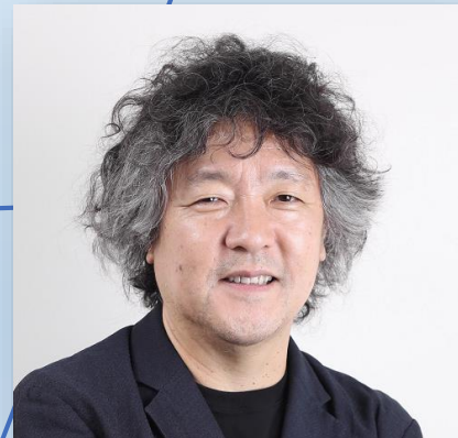
脳科学者 茂木 健一郎氏