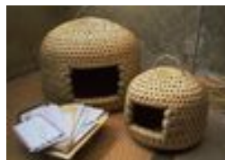
職人の技が光る 伝統的工芸品