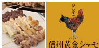
おいしい信州ふード（風土）

地域資源製品開発支援センター支援商品 しあわせ信州食品開発センター支援商品 信州ベンチャー企業優先発注事業製品 信州木材認証商品 など