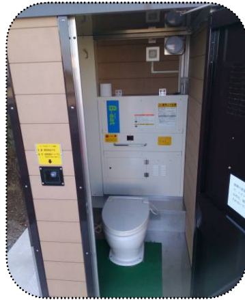
○大鹿村 [ビガーランド公衆トイレ]