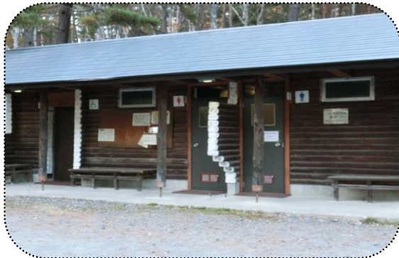
○長野市 [一の鳥居苑地駐車場トイレ]