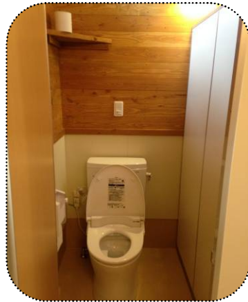
○木曾町 [開田高原 管沢公衆トイレ]