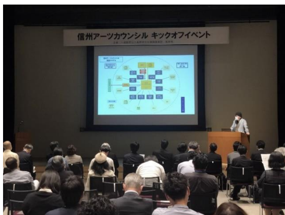
信州アーツカウンシル キックオフイベント (令和4年6月11日)

具体的な事業として、文化芸術の創造性を発揮し、社会包摂、地域振興等の課題に向け地域の新たな協働を生み出す取組に対して、助成と相談・助言をセットにした寄り添い型の支援を行い、担い手の活動を後押しします。また、アートと地域をつなぐ人材育成や文化芸術に関する情報発信を行います。これらの取組を通じて、県内の文化芸術活動が持続的に発展する環境づくりにつなげます。