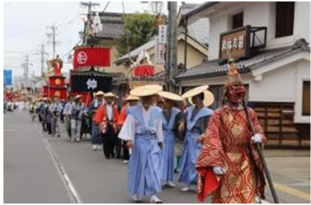
県指定無形民俗文化財「須坂祇園祭」(須坂市) (令和2年9月28日指定)