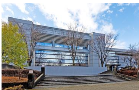
伊那文化会館（伊那市）