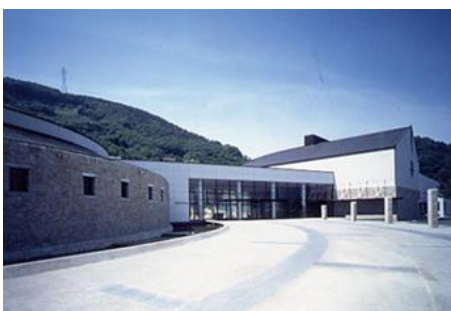
長野県立歴史館（千曲市）