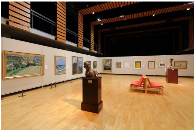
2022 年度 長野県立美術館移動展 「松川村でたどる信州のアート」