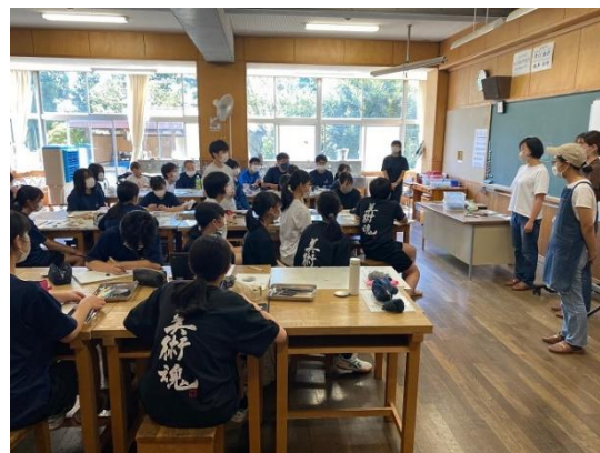
東京藝術大学連携事業 令和4年度 安曇野アーティスト・イン・レジデンス (中学生向けワークショップの様子)