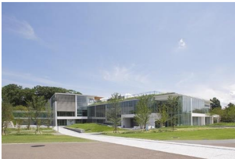
長野県立美術館（長野市）