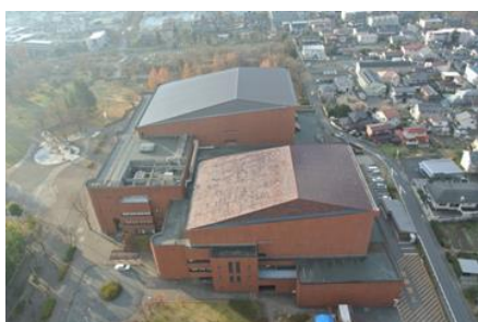
県民文化会館（長野市）