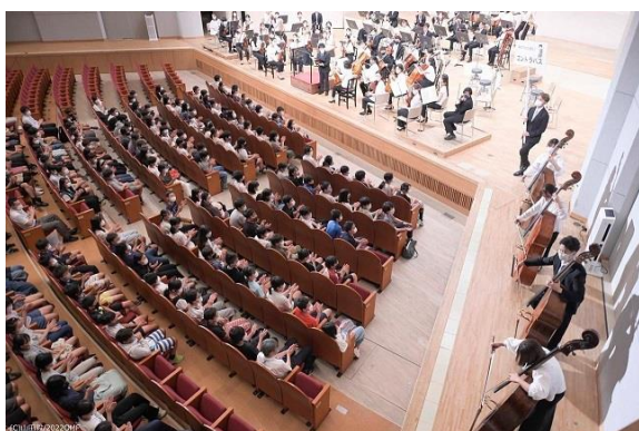
セイジ・オザワ 松本フェスティバル 2022 子どものための音楽会

加えて、学校において演劇的な手法や芸術表現などの学びを取り入れる「演劇による学び」プロジェクトとして、県・市町村の教育委員会との連携により、小中学校や特別支援学校でのプログラムの実施、教員向けワークショップの開催、文化芸術団体等との連携によるファシリテーター養成講座の開催等を実施し、学校現場において、子どもたちのコミュニケーション力や創造力、他者理解力や自己肯定感を高めることができるよう、環境づくりに取り組みました。