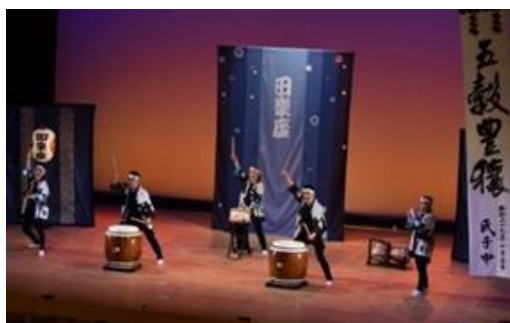
信州・アート・リングス「信州の伝統芸能フェスティバル」

また、令和2年（2020年）2月には、県内の文化施設や行催事をはじめ文化芸術の情報を一元的に発信するウェブサイト「CULTURE.NAGANO」を構築しました。