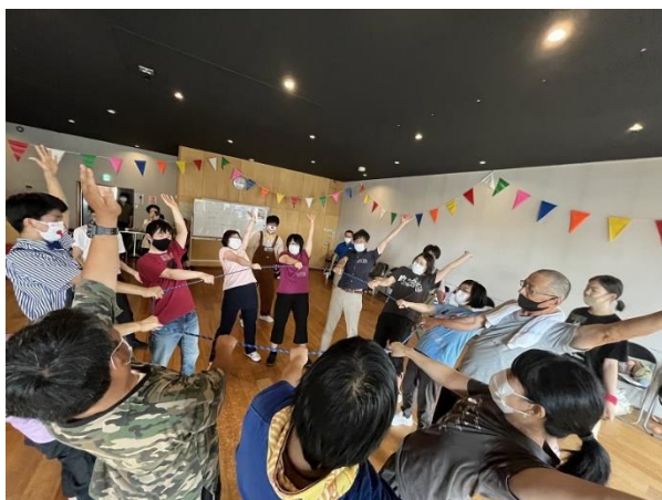
信州アーツカウンシル 令和4年度助成事業 JDS「つながるサーカスワークショップ」