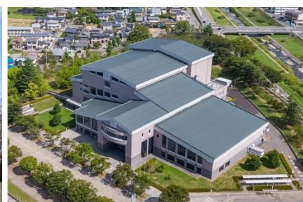
松本文化会館（松本市）