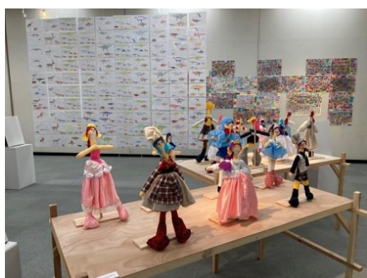
スキスギテステキ。ザワメキアート展 2022

加えて、広い県土と77の市町村をもつ本県においては、文化施設へのアクセスが困難な地域も存在するため、県立文化施設によるアウトリーチ 4 活動を実施しました。県立文化会館による福祉施設や公民館等での演奏会の開催、県立美術館による移動展の開催、県立歴史館の「お出かけ歴史館」や「出前講座」の開催等を通じて、県民が文化芸術に親しむ機会の創出に努めました。