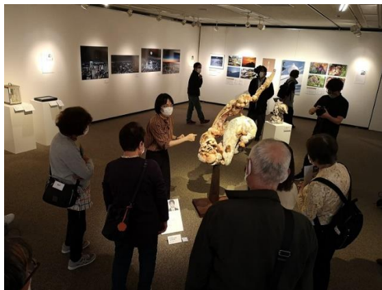
信州アーツカウンシル主催事業 「Re-SHINBISM1 そして未来へ」展 対話を通じた作品鑑賞会