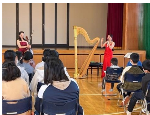
信州アートサンタ・プロジェクト