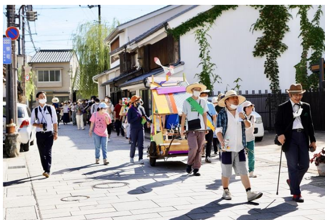
信州アーツカウンシル 令和4年度助成事業 NPO法人リベルテ「路地の開きーリベルテの福祉施設を開き 多様な人との関わり合いをつくるアートプロジェクトー」