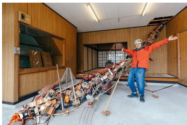
信州アーツカウンシル 令和4年度助成事業 「捨てる神あれば拾う神あり@トビチ美術館」