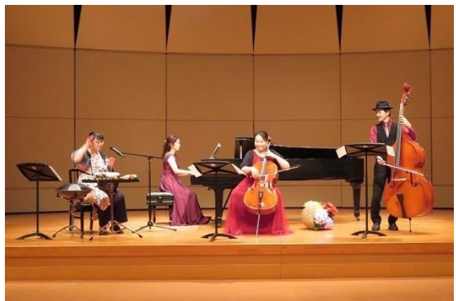
伊那文化会館アウトリーチ活動 (養護学校への音楽のライブ配信)