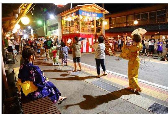
UNESCO 無形文化遺産に登録された「風流踊」に含まれる県内の伝統芸能 （左上：跡部の踊り念仏（佐久市）、右上：和合の念仏踊（阿南町）、左下：新野の盆踊（阿南町））