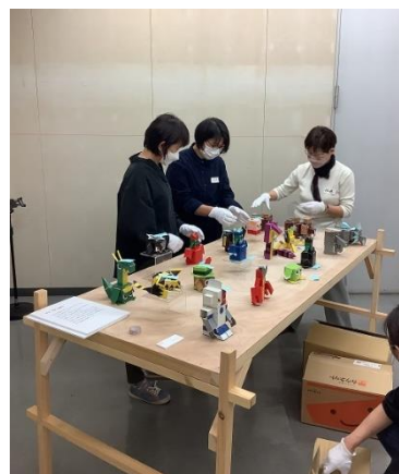
ザワメキサポートセンター 障がい者芸術に係る人材育成研修