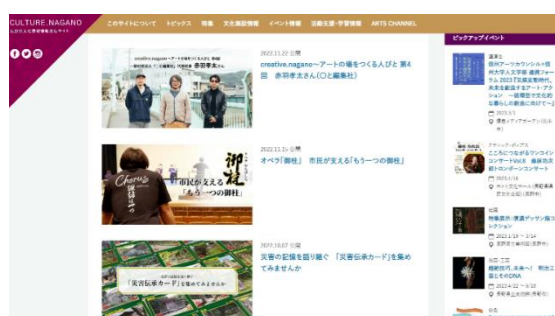
長野県文化芸術情報発信サイト「CULTURE.NAGANO」