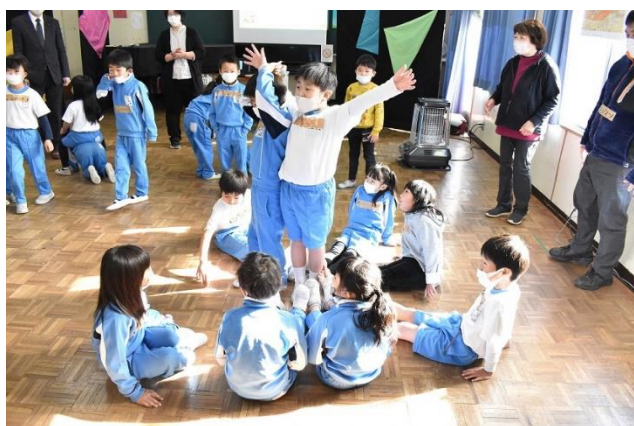
「演劇による学び」推進事業ワークショップ (令和5年度以降「アートの手法を活用した学び」推進事業)