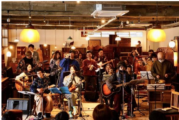
NAGANO ORGANIC AIR 「たまに集まるナガノなんでもプロジェクト」（長野市）

また、国立大学法人東京藝術大学との包括連携協定に基づき、安曇野市等と連携しながら、同大学に関係する芸術家の滞在制作を通じた AIR の受け入れ環境づくりを行っています。