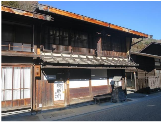
国指定重要文化財「旧中村家住宅」(塩尻市) (令和2年12月23日指定)