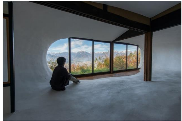
北アルプス国際芸術祭 2020-2021