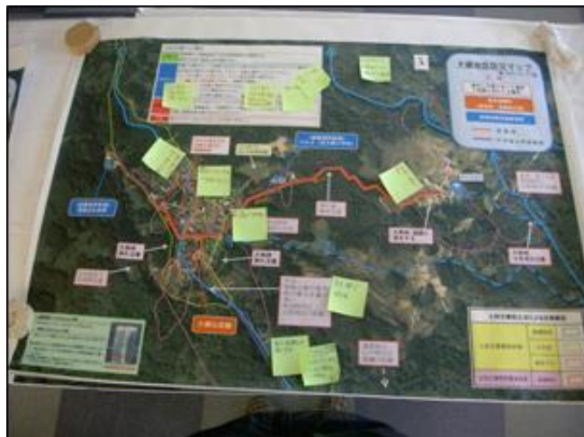
▲あと少しで地区防災マップの完成です