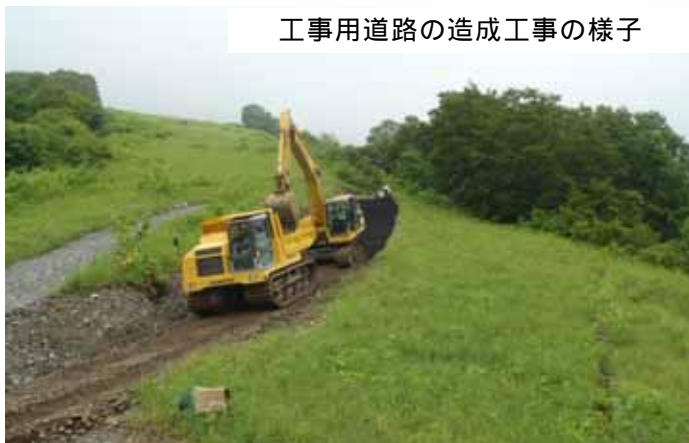
工事用道路の造成工事の様子