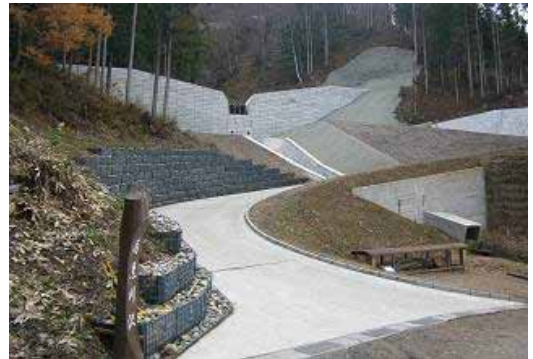
南黒川沢 小谷村 黒川