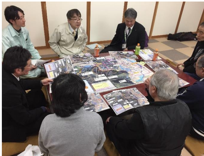
地区懇談会の様子(3班のうちの1班)