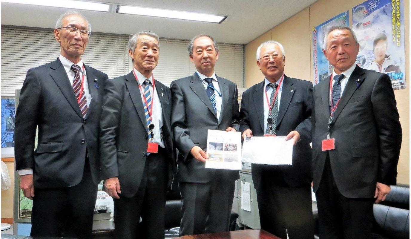
砂防部長に要望書を提出

この意見交換会は、姫川支部が毎年独自に行っているもので、直接管内の状況を説明できる大変貴重な機会ですので、今後も姫川支部の重要な事業として継続していく予定です。