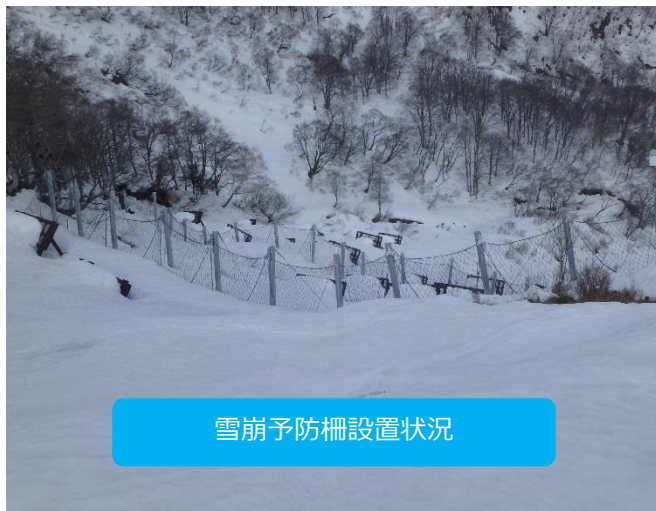
雪崩予防柵設置状況