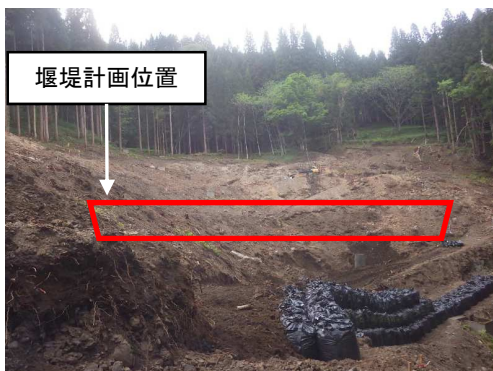
現場全景 (5月中旬撮影)

透過型堰堤には鋼製スリットがあるため、平時は水の流れを阻害しません。土石流発生時にはスリット部が閉塞し、土石や流木の流下を防ぎます