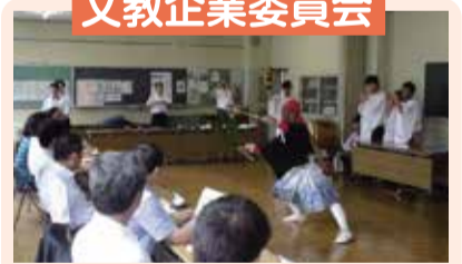
阿南高等学校の調査

7月16日～17日に総合教育センターなど4現地機関と松本県ヶ丘高等学校など3教育機関を調査するとともに、(福)信濃医療福祉センターを視察しました。