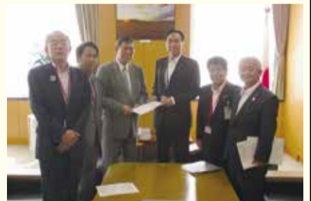
石破地方創生担当大臣に要請

6月15日(月)、西沢議長が、知事、県市長会長、県町村会長らとともに、地方創生や防災・減災対策の推進、医師確保対策などについて関係省庁へ要請活動を行いました。