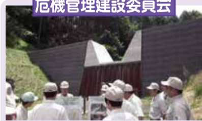
火山砂防事業の調査

7月21日～22日に佐久建設事務所など2現地機関と道路事業など8か所を調査するとともに、浅間山火山防災連絡事務所など3か所を視察しました。