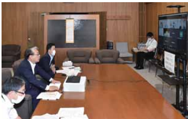
地域住民等との意見交換(オンライン)の様子

議員が地域の諸課題などについて県民のみなさんと意見交換したり、議会の活動内容を直接お知らせしたりする「こんにちは県議会です」(県政報告会・ふれあいミーティング)を開催しています。