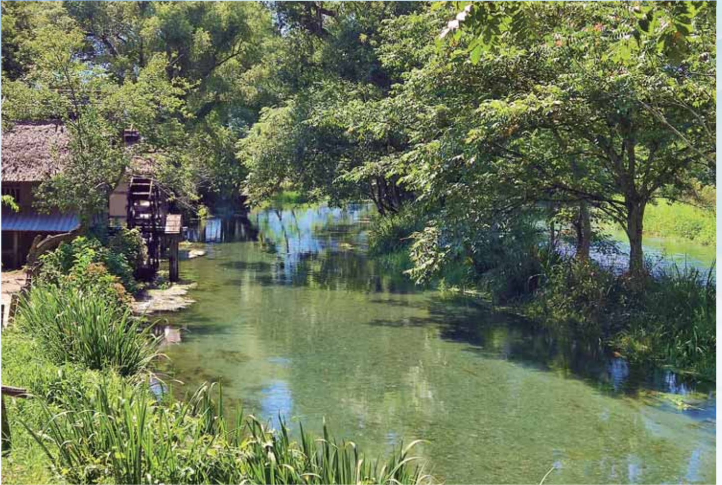
蓼川と水車小屋(安曇野市)