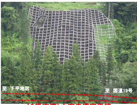
(2級市道)大安寺橋宮平線