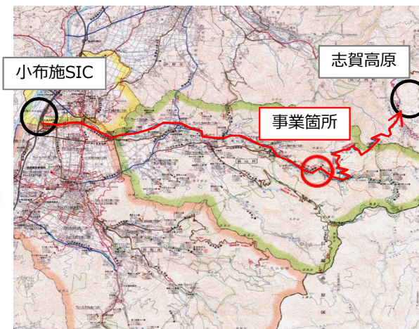
●小布施SICと志賀高原を結ぶ主要道路