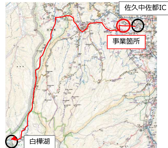
● 佐久中佐都ICと白樺湖を結ぶ主要道路