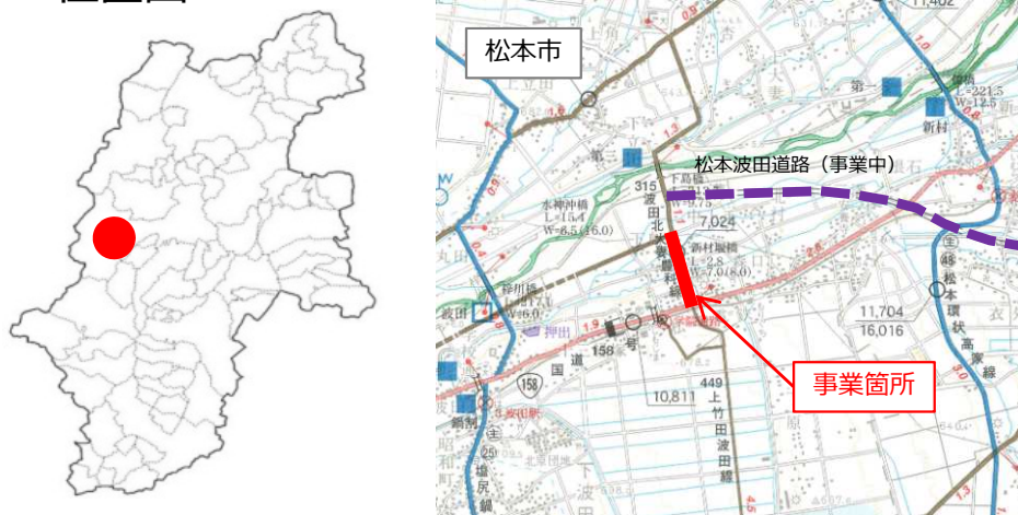
松本波田道路と国道158号を結ぶ主要道路