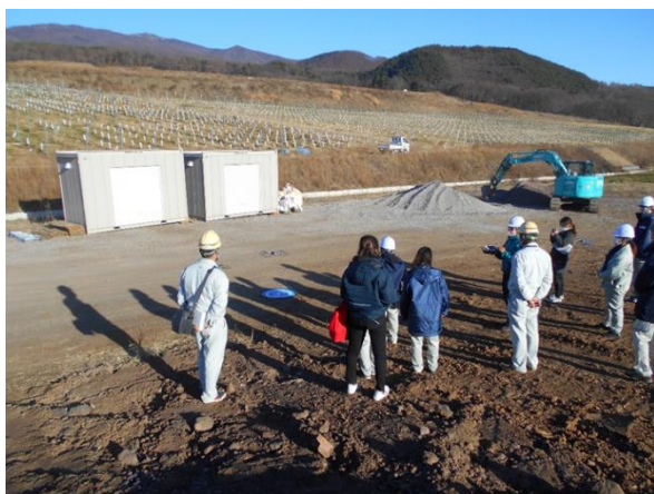
ドローン飛行操作方法の講習