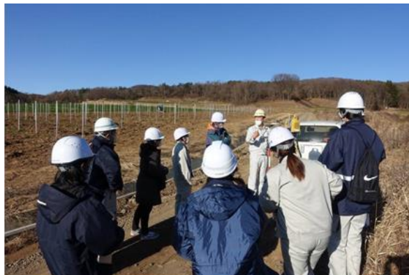
施工状況や ICT 活用を見学