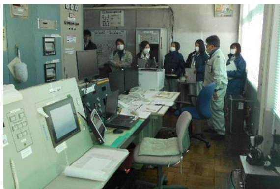
更新となる水管理制御施設を見学