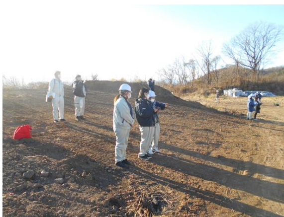
グループに分かれ実際に操縦を体験