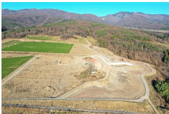
ドローンで現場の空撮写真を撮影