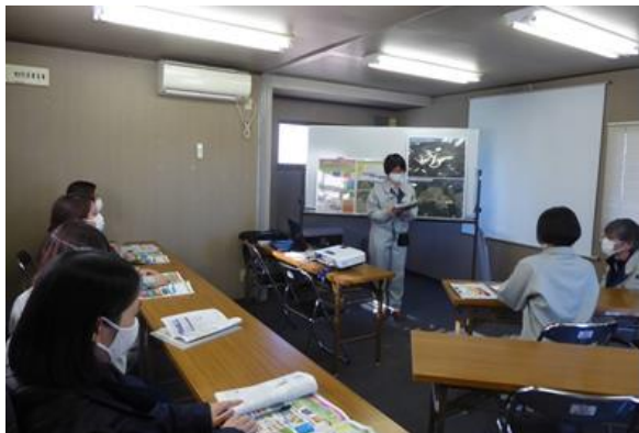
工事概要等の説明