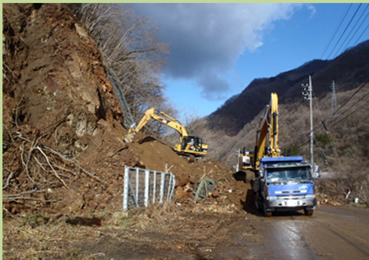
国道に崩落した大量の土砂の搬出 (白馬村 通地区)