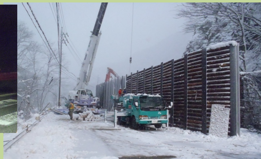
雪のなか通行の安全を図る仮設防護柵設置

12月最低気温がマイナス10℃以下になる寒さのなか 誘導を行う作業員の眼差しは厳しい