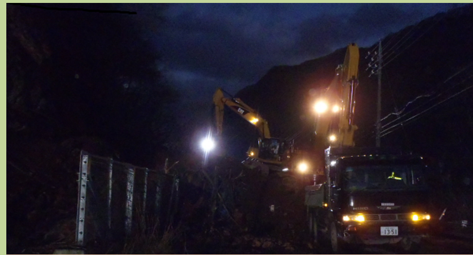
早期復旧に向け、夜間も照明をつけ、続けられる 土砂撤去作業