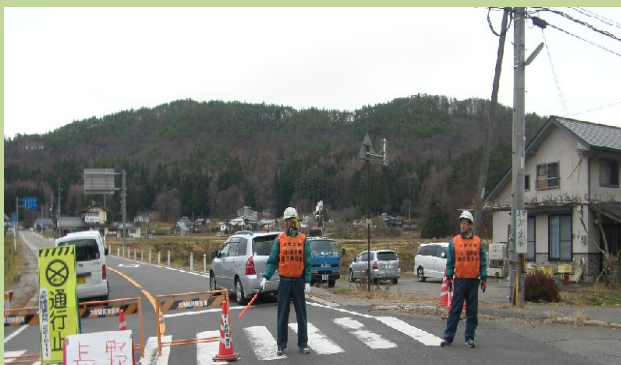
交通誘導の状況(白馬村)