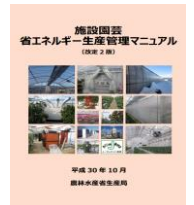
▲省エネマニュアル