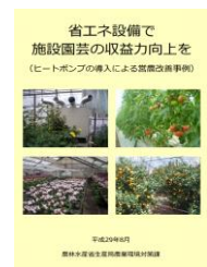
▲省エネで収益力向上を