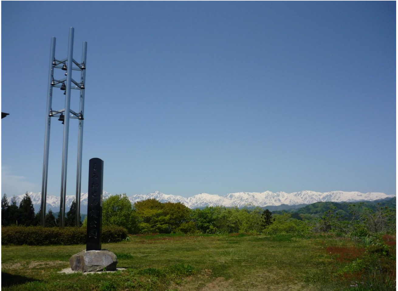
しあわせの鐘公園(長野市中条)から望む北アルプス