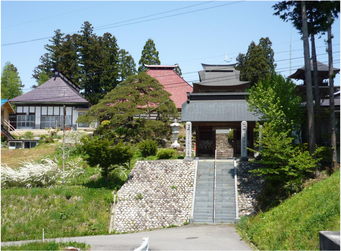
信濃三十三番観音札所結願所の高山寺(小川村)