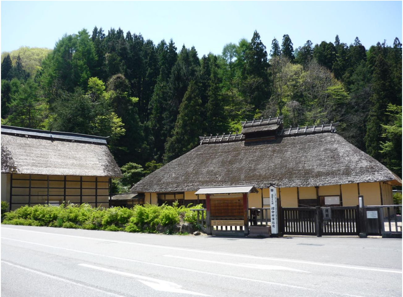
元禄11(1698)年に建立された国の重要文化財「旧中村家住宅」(大町市美麻)