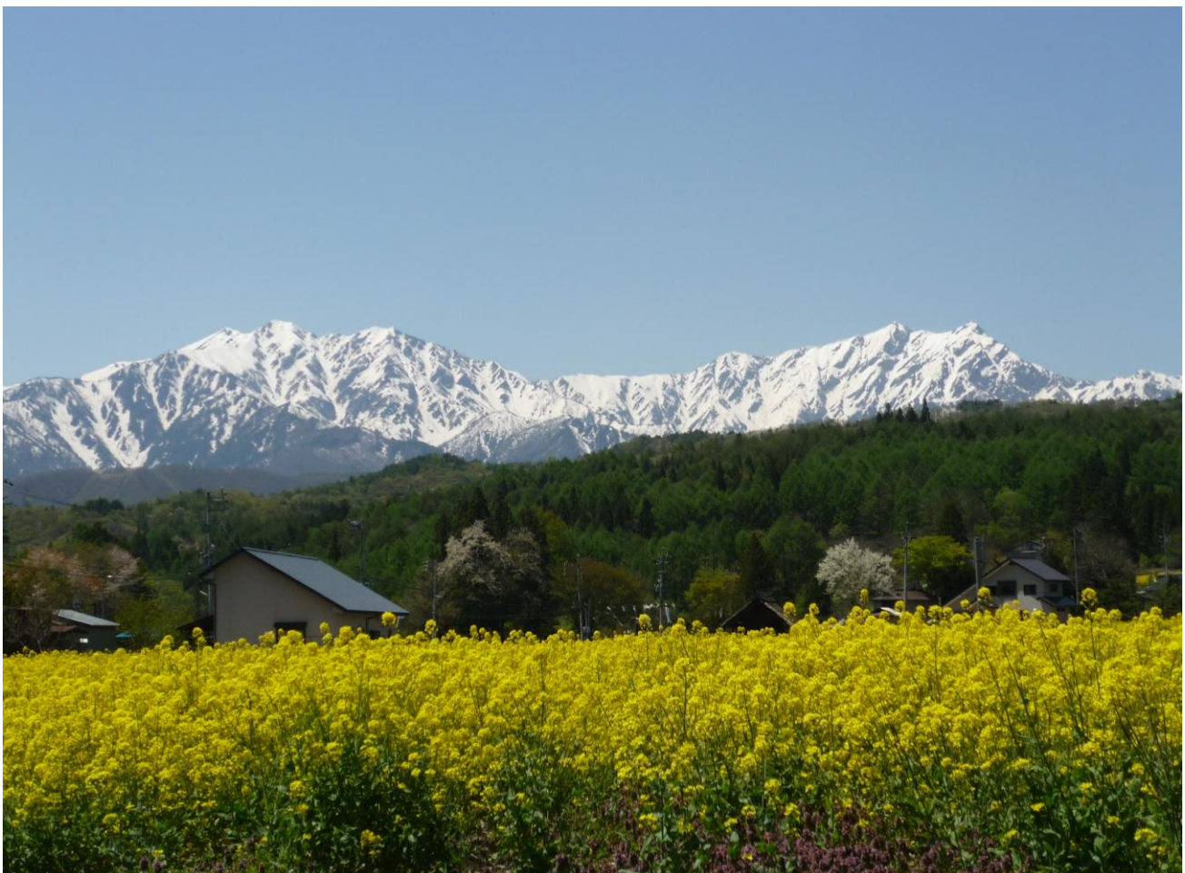
新行(大町市美麻)から望む翁ヶ岳(左)と鹿島槍ヶ岳(右)