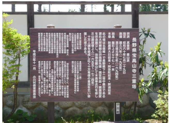
長野県宝高山寺三重塔(小川村)