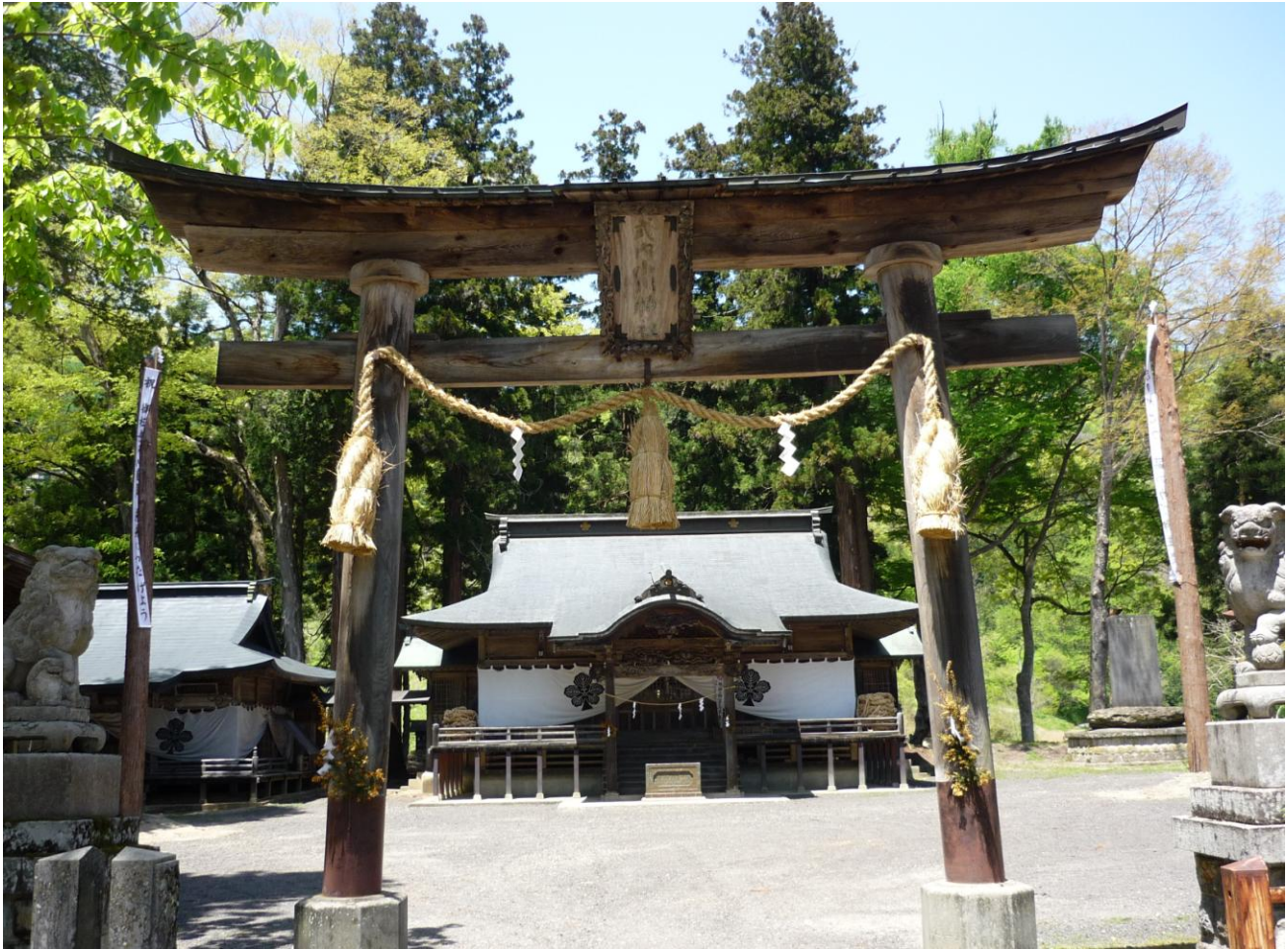
北信濃随一の賑やかさを誇る御柱祭で有名な小根山小川神社(小川村)