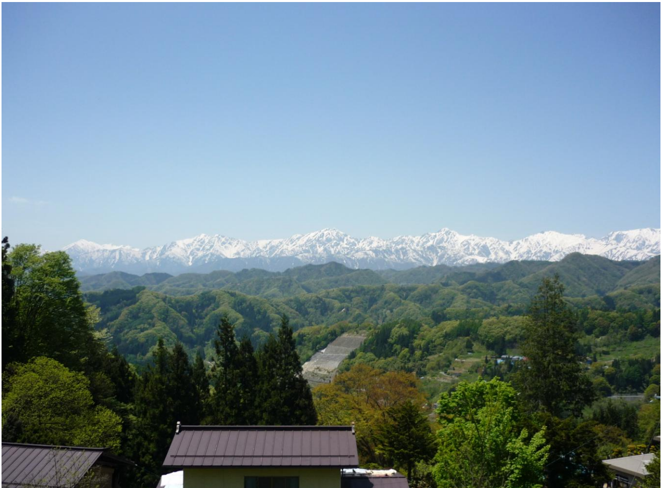
高山寺から望む北アルプス