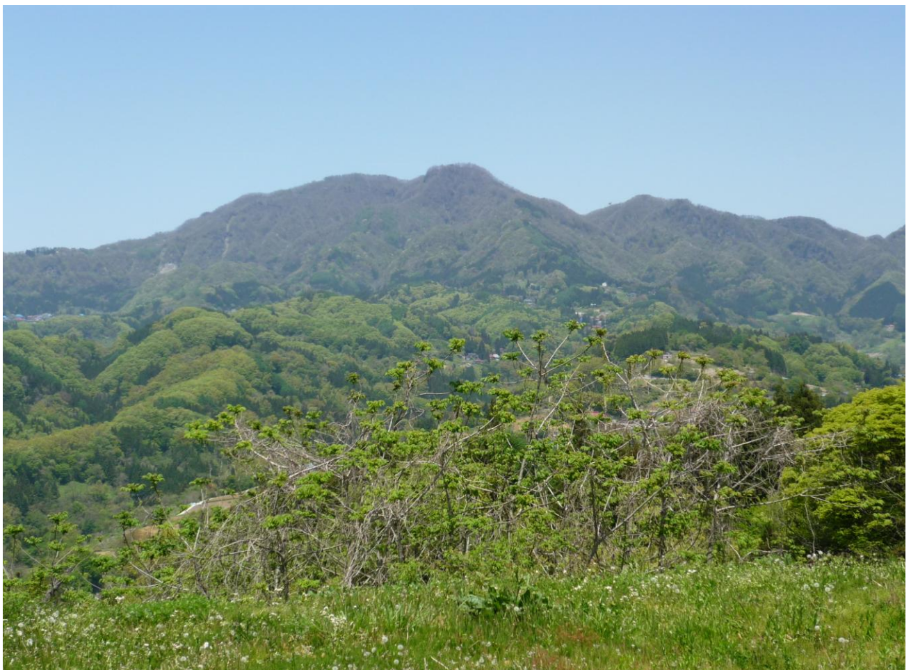
しあわせの鐘公園(長野市中条)から望む虫倉山