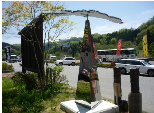
道の駅「おがわ」にある本州の重心を示すモニュメント