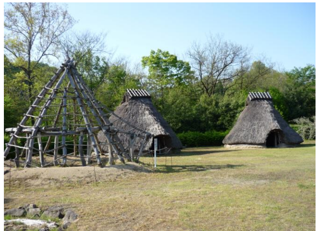
縄文時代の遺跡「市史跡宮遺跡」(長野市中条)