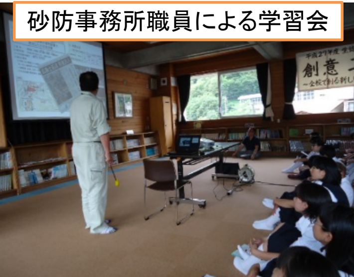
砂防事務所職員による学習会