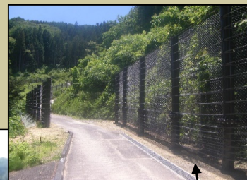
崩壊土砂防止柵 H=3.0~4.0m L=385m