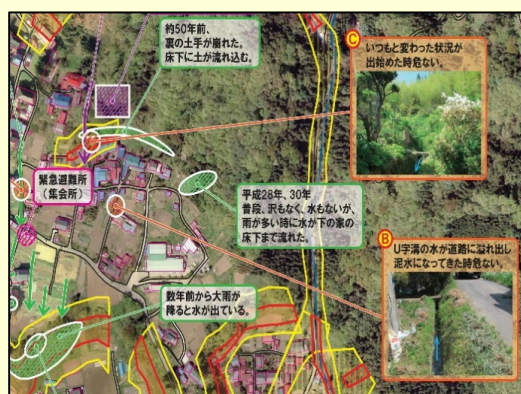
地区防災マップの例