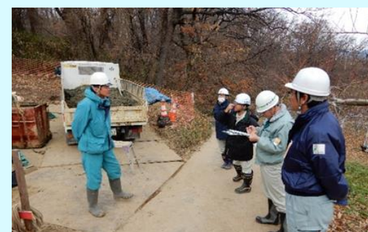
長野市篠ノ井瀬原田の集水井工事