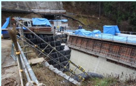
小川村稲丘の砂防堰堤工事