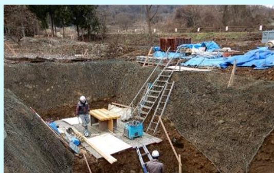
長野市信更町吉原の床固め工事