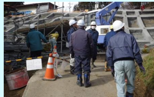
長野市中条小手屋の法枠工事