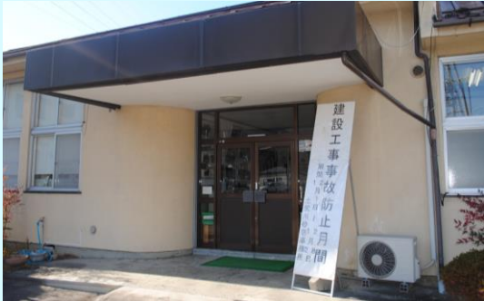
土尻川砂防事務所玄関前の立看板

点検した現場は、それぞれ安全対策が施されていたところですが、引き続き、労働災害等の防止に努めてまいります。