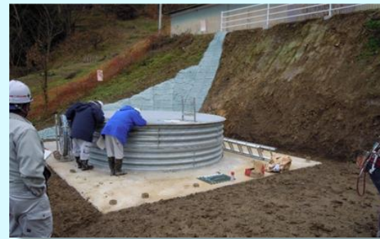
長野市信州新町日時の集水井(しゅうすいせい)工事