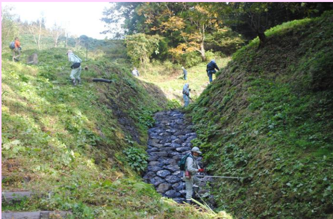
急峻な富吉沢(とみよしざわ)水路工

石張り水路工が国の「有形登録文化財」に認定されたのは、平成21年1月。年明けの1月で登録10周年の節目を迎えます。