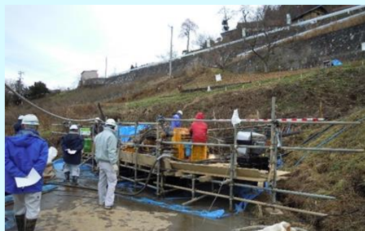
長野市大岡栗尾の横ボーリング工事