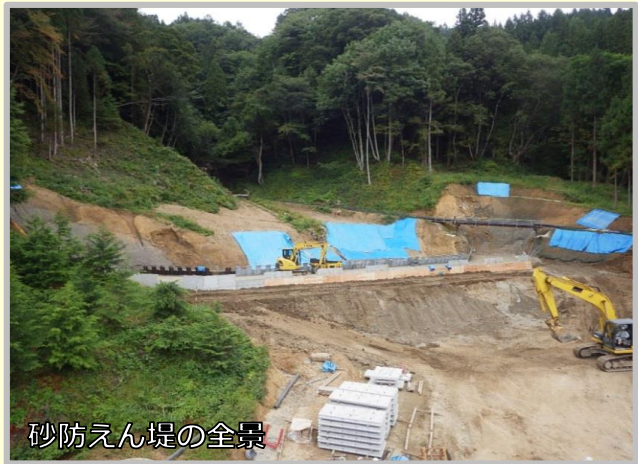
砂防えん堤の全景

現地発生土とセメントを施工現場で攪拌・混合してえん堤本体の内部に充填するインセム工法を採用し、工事費の縮減を図っています。