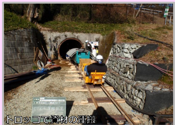
トロッキで資材の運搬