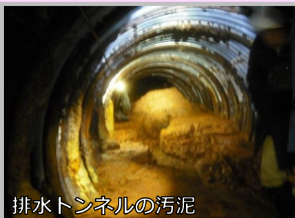
排水トンネルの汚泥