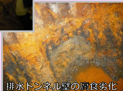
排水トンネル壁の腐食劣化