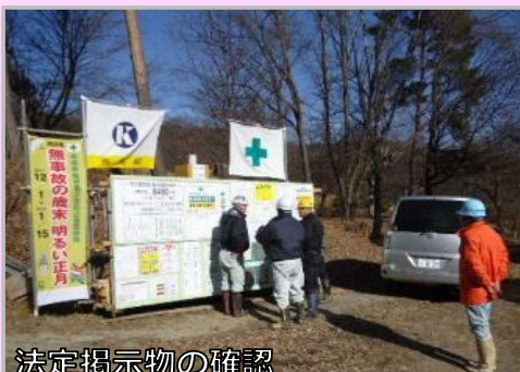
法定掲示物の確認