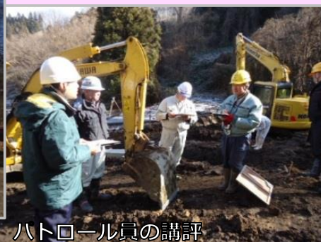
パトロール員の講評