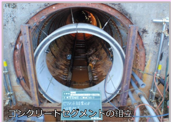
コンクリートセグメントの組立

平成22～32年度の地すべり防止対策施設の改築事業で、長野市篠ノ井茶臼山の排水トンネル及び集水井の修繕と集水ボーリングの更新を行っています。