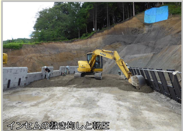
インセムの敷き均しと転圧