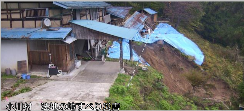
小川村 法地の地すべり災害

10月22日の台風21号、10月28日の台風22号の豪雨により、長野市15箇所（中条9箇所、七二会3箇所、小田切2箇所、大岡1箇所）と小川村6箇所、計21箇所の土砂災害が発生しましたが、幸い、人的被害はありませんでした。