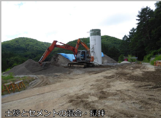
土砂とセメントの混合・攪拌