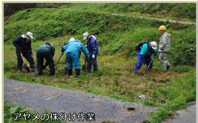
アヤメの株分け作業

台風21号が通過した直後で石張水路の流量が多かったため、遊歩道周辺の草刈りとアヤメの株分け作業を行いました。事故やけがも無く、効率的に作業を終了することができました。