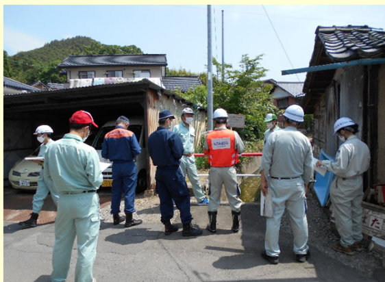
土石流危険渓流の確認

6～7月は土砂災害が発生する割合が高い時期です。災害を他人事としてとらえることなく、