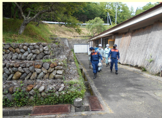
地すべり危険箇所（特別養護老人ホーム裏）の点検