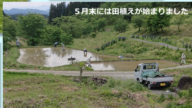
5月末には田植えが始まりました