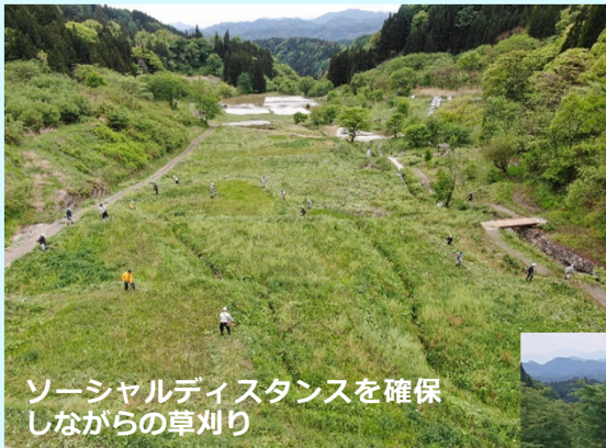
ソーシャルディスタンスを確保しながらの草刈り

例年は、砂防ボランティアや小川中学校の生徒の皆さんも参加し、総勢100名以上により行われる恒例の行事ですが、今年は新型コロナウイルスの感染拡大防止のため、地元の皆さんと協力企業、行政関係者などに参加者を限定、草刈り範囲も縮小して行われました。