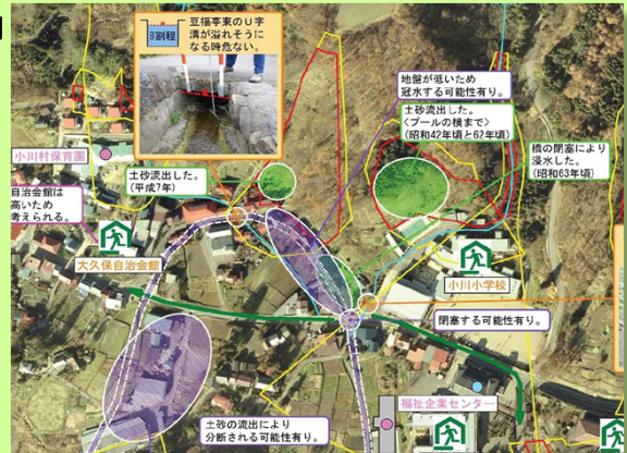
地区防災マップの例