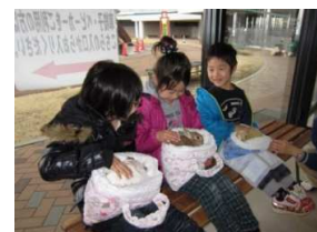
動物とのふれあい