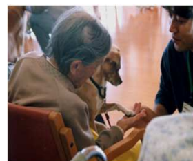
動物ふれあい訪問