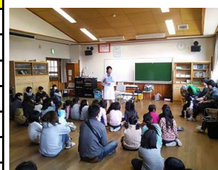
動物ふれあい教室(出前教室)