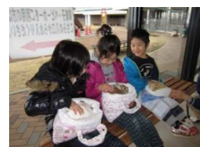
動物とのふれあい