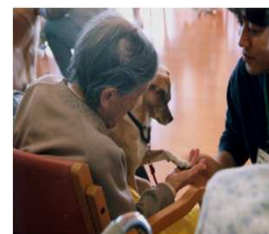
動物ふれあい訪問