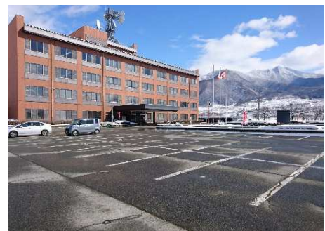
正面玄関側駐車場