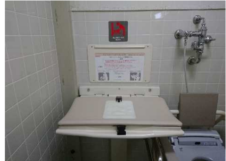
1階多目的トイレ内