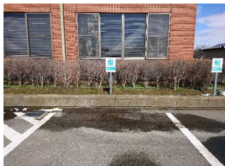
正面玄関側駐車場