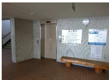
1階エレベーターホール