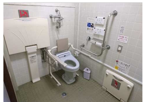
1階多目的トイレ内