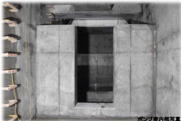
ポンプ室内部写真