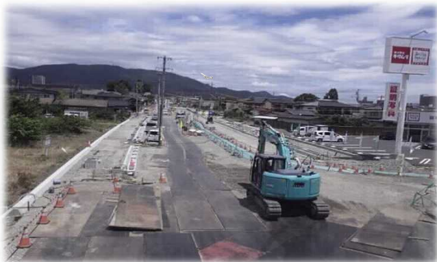
現在、側溝工ほか施工中