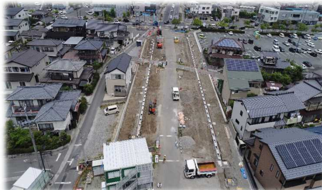
現在、側溝工ほか施工中