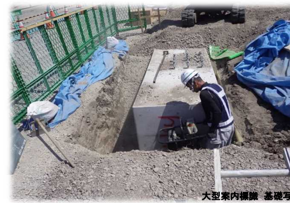
大型案内標識 基礎写真