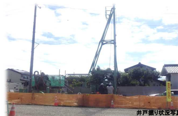
井戸掘り状況写真