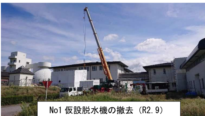
No1 仮設脱水機の撤去 (R2.9)

更に、汚水を浄化する際に発生する汚泥の脱水機も2台中1台が10月に復旧し、屋外に設置していた仮設の汚泥脱水機2台のうち1台を撤去しました。