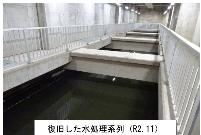
復旧した水処理系列 (R2.11)

更に、汚水を浄化する際に発生する汚泥の脱水機も2台中1台が10月に復旧し、屋外に設置していた仮設の汚泥脱水機2台のうち1台を撤去しました。