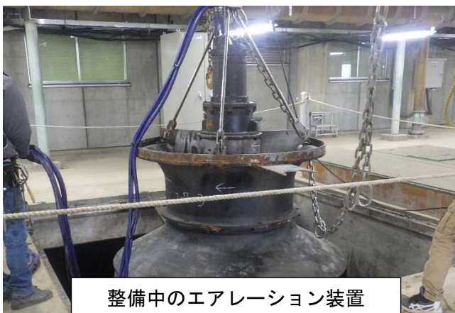
整備中のエアレーション装置