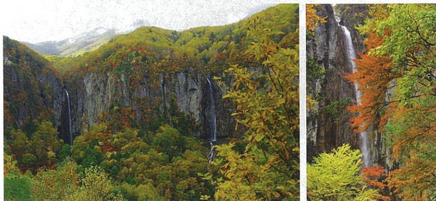
流れ落ちる不動滝(落差85m)と権現滝(落差75m)。

根子岳と四阿山をそれぞれの源流に、静寂な谷あい に轟音をたてて流れ落ちる不動滝(落差85m)と権現 滝(落差75m)。米子大瀑布とは2つの滝の総称であり、 日本の滝100選に数えられています。10月中旬には、紅 葉も見頃となり美しい景色が楽しめます。