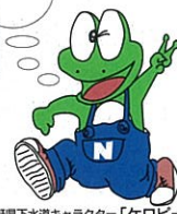
長野県下水道キャラクター「ケロビー」