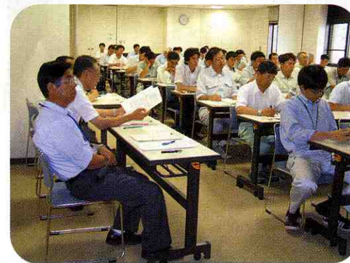
研修会当日の写真です。

7月11日(水)「下水道危機管理研修会」が行われました。阪神淡路大震災・中越地震・能登地震での、下水道被害調査・災害査定現場指揮者や下水道管路の維持管理専門家を講師に招き、上流管理事務所(アクアパル千曲)において、約80名の市町村・建設事務所・下水道公社の職員が研修を受けました。