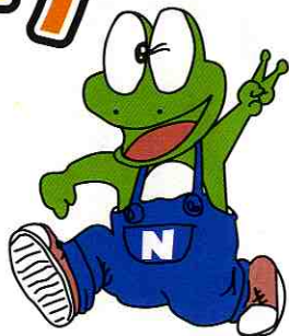
長野県下水道キャラクター「ケロビー」

この催しは、「下水道の日」(9月10日)にちなんで、上流処理区終末処理場(愛称:アクアパル千曲)と交互に、毎年行っています。