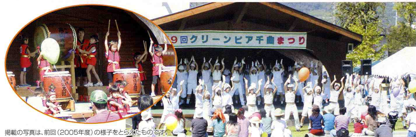
掲載の写真は、前回(2005年度)の様子をとらえたものです。