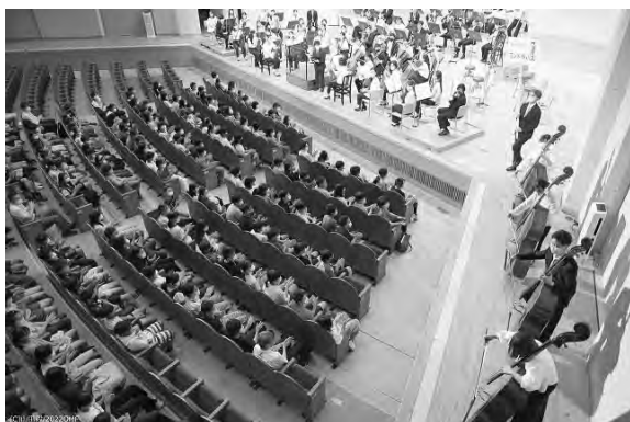
セイジ・オザワ 松本フェスティバル 2022 子どものための音楽会

加えて、学校において演劇的な手法や芸術表現などの学びを取り入れる「演劇による学び」プロジェクトとして、県・市町村の教育委員会との連携により、小中学校や特別支援学校でのプログラムの実施、教員向けワークショップの開催、文化芸術団体等との連携によるファシリテーター養成講座の開催等を実施し、学校現場において、子どもたちのコミュニケーション能力や創造力、他者理解力や自己肯定感を高めることができるよう、環境づくりに取り組みました。