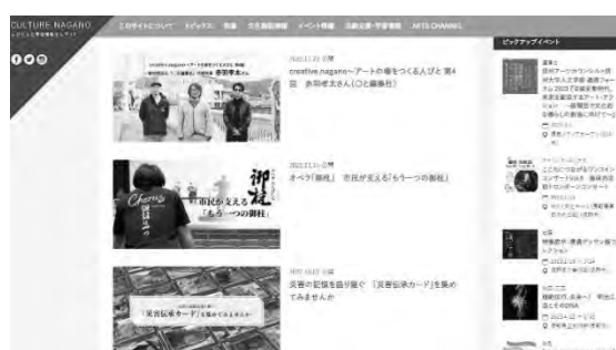
長野県文化芸術情報発信サイト「CULTURE.NAGANO」