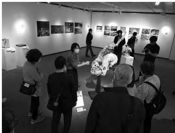
信州アーツカウンシル主催事業 「Re-SHINBISM1 そして未来へ」展 対話を通じた作品鑑賞会