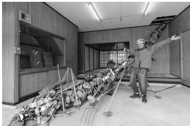
信州アーツカウンシル 令和4年度助成事業 一般社団法人〇と編集社 「捨てる神あれば拾う神あり@トビチ美術館」