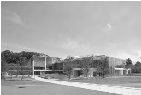
長野県立美術館（長野市）