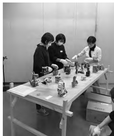
ザワメキサポートセンター 障がい者芸術に係る人材育成研修