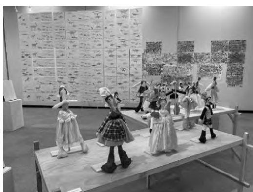
スキスギテストキ。ザワメキアート展 2022

加えて、広い県土と77の市町村をもつ本県においては、文化施設へのアクセスが困難な地域も存在するため、県立文化施設によるアウトリーチ 4 活動を実施しました。県立文化会館による福祉施設や公民館等での演奏会の開催、県立美術館による移動展の開催、県立歴史館の「お出かけ歴史館」や「出前講座」の開催等を通じて、県民が文化芸術に親しむ機会の創出に努めました。