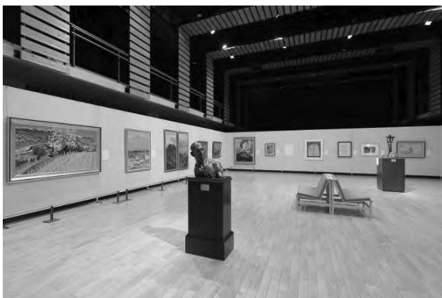
2022年度 長野県立美術館移動展 「松川村でたどる信州のアート」