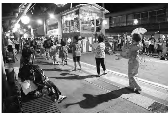
UNESCO 無形文化遺産に登録された「風流踊」に含まれる県内の伝統芸能 （左上：跡部の踊り念仏（佐久市）、右上：和合の念仏踊（阿南町）、左下：新野の盆踊（阿南町））