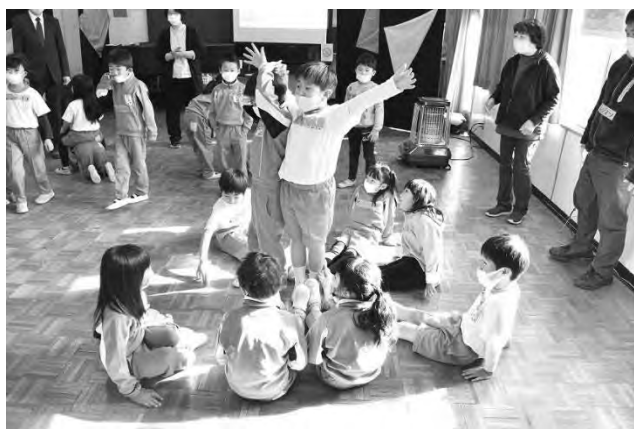
「演劇による学び」推進事業ワークショップ (令和5年度以降「アートの手法を活用した学び」推進事業)