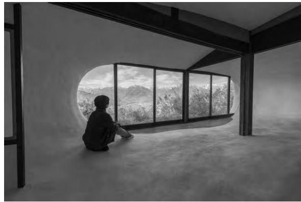
北アルプス国際芸術祭 2020-2021