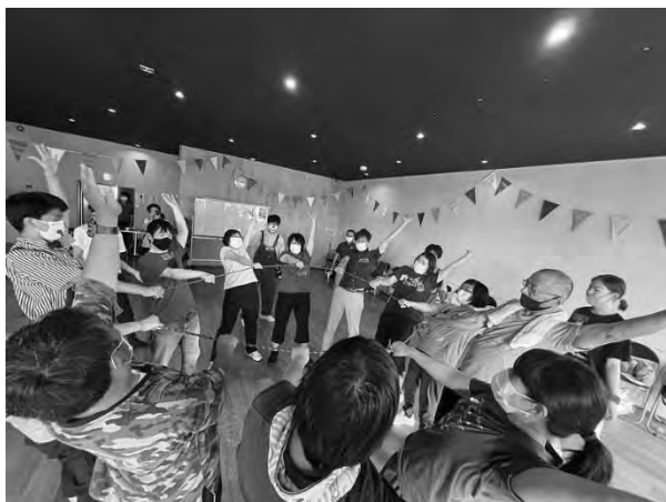
信州アーツカウンシル 令和4年度助成事業 JDS「つながるサーカスワークショップ」