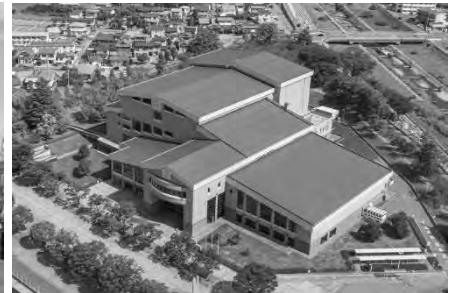
松本文化会館（松本市）