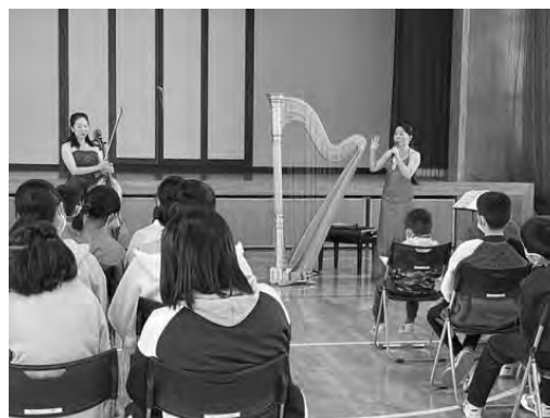
信州アートサンタ・プロジェクト