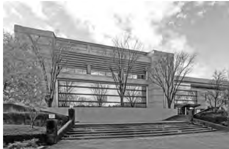
伊那文化会館（伊那市）