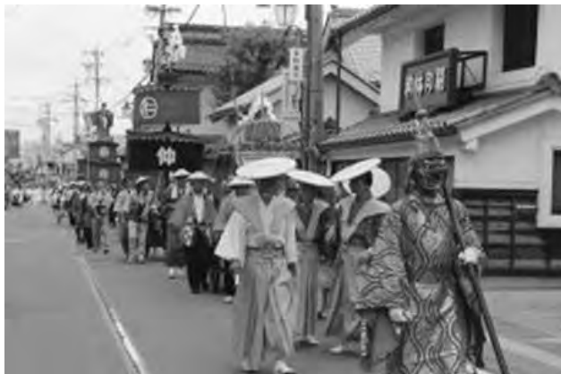
県指定無形民俗文化財「須坂祇園祭」(須坂市) (令和2年9月28日指定)