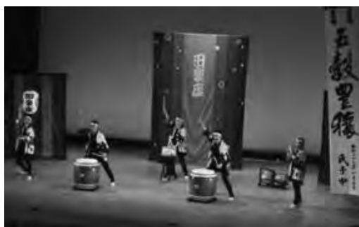
信州・アート・リングス「信州の伝統芸能フェスティバル」

また、令和2年（2020年）2月には、県内の文化施設や行催事をはじめ文化芸術の情報を一元的に発信するウェブサイト「CULTURE.NAGANO」を構築しました。