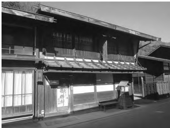
国指定重要文化財「旧中村家住宅」(塩尻市) (令和2年12月23日指定)