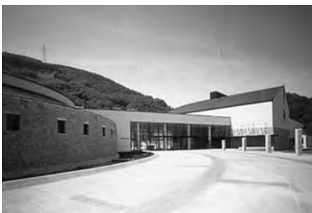
長野県立歴史館（千曲市）