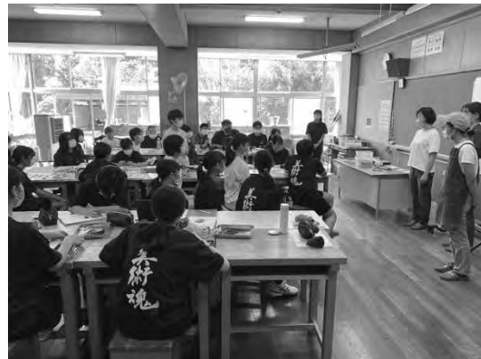
東京藝術大学連携事業 令和4年度 安曇野アーティスト・イン・レジデンス (中学生向けワークショップの様子)