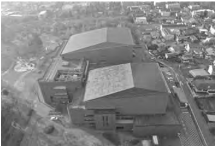
県民文化会館（長野市）