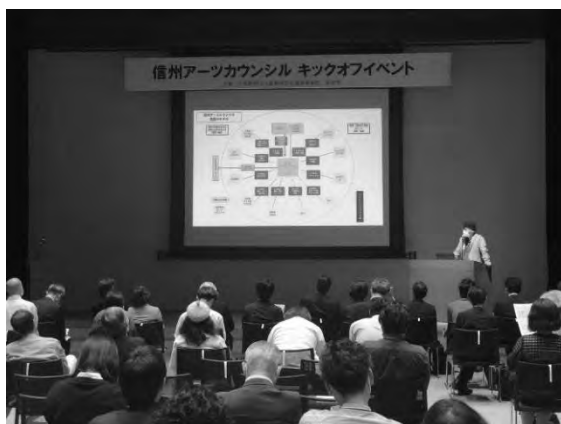
信州アーツカウンシル キックオフイベント (令和4年6月11日)

具体的な事業として、文化芸術の創造性を発揮し、社会包摂、地域振興等の課題に向け地域の新たな協働を生み出す取組に対して、助成と相談・助言をセットにした寄り添い型の支援を行い、担い手の活動を後押しします。また、アートと地域をつなぐ人材育成や文化芸術に関する情報発信を行います。これらの取組を通じて、県内の文化芸術活動が持続的に発展する環境づくりにつなげます。