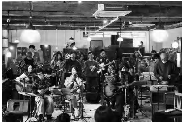
NAGANO ORGANIC AIR 「たまに集まるナガノなんでもプロジェクト」（長野市）

また、国立大学法人東京藝術大学との包括連携協定に基づき、安曇野市等と連携しながら、同大学に関係する芸術家の滞在制作を通じた AIR の受け入れ環境づくりを行っています。