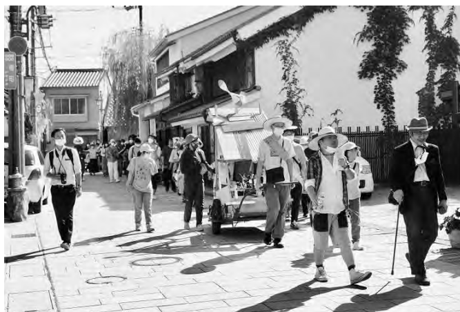
信州アーツカウンシル 令和4年度助成事業 NPO法人リベルテ「路地の開きーリベルテの福祉施設を開き 多様な人との関わり合いをつくるアートプロジェクトー」