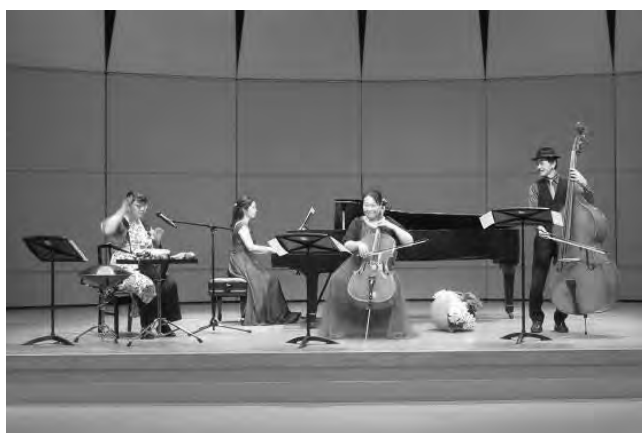
伊那文化会館アウトリーチ活動 (養護学校への音楽のライブ配信)