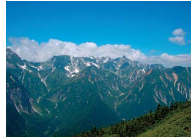
蝶ヶ岳山頂からの眺望。中央右奥の岩峰が槍ヶ岳。そこから左方に大喰岳、中岳、南岳と続き、稜線が大きく落ち込む場所が「大キレット」。その下方左手前の岩壁が「屏風岩」。写っている範囲の全てが「特別名勝及び特別天然記念物上高地」に含まれ、峡谷の様子がわかる。