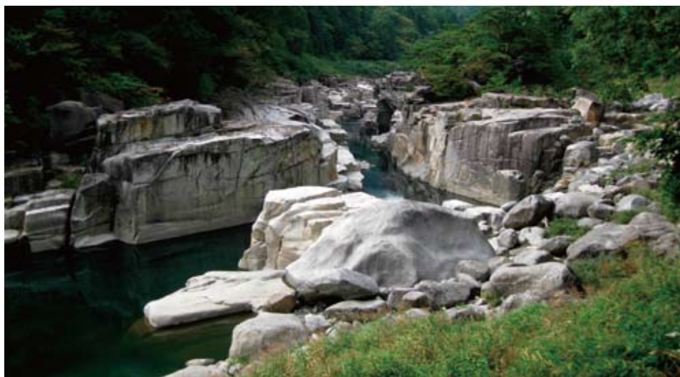
寝覚の床、中央の木曽川の右側の岩の上にこんもり茂るのが「床島」の松林

木曽川が基盤の花崗岩を浸食して形成された寝覚の床は、節理に沿って方形に残った白い岩と、その中央にある床島の松の緑のコントラストが核になっています。独特の峡谷の地形と、いわゆる「白砂青松」の景色に似た色彩のコントラスト