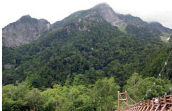
明神橋から明神岳を望む

上高地の自然景観は江戸時代にはすでに知られており、『信濃奇勝録』には「自然の林泉(庭園)」のようだと記され、「柳林」の存在にも触れられています。この時代の景観評価には特色があり、その核心に明神岳と穂高神社奥宮が据えられています。享保9年(1724年)に完成した『信府統記』が、明神池のことを「大明神の御手洗」と記しているのはこれを良く示しています。現在でも「明神橋」の袂に立つと、正面に明神岳がそびえています。もう一つ忘れてならないのは、「近代登山」の景観です。現在と違って徳本峠や蝶ヶ岳を越えて上高地に入った時代に最初に目に飛び込んできた峰々や、山岳会・大学山岳部が屏風岩などの新しい登攀ルート開拓にしのぎを削った頃の上高地の風景は、登山の景観を代表するものと言えるでしょう。