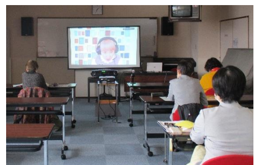
＜パブリックビューイング会場＞