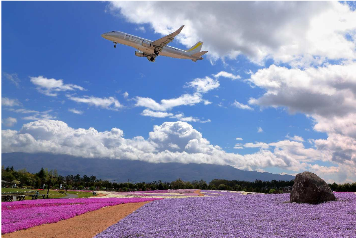
令和元年度信州まつもと空港写真コンクール 優秀賞作品