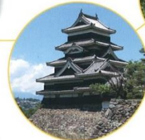
国宝松本城(松本市)