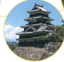
国宝松本城(松本市)