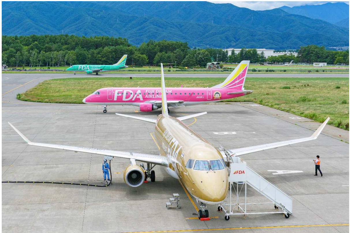
令和元年度信州まつもと空港写真コンクール 入選作品