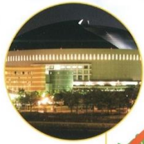
福岡ドーム(福岡市)