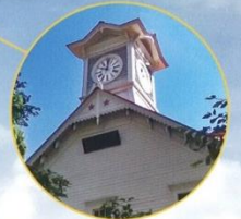
札幌時計台(札幌市)